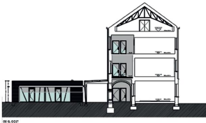
vanuit de labo's gezien

Eenmaal deze fase afgerond, komt waar de huidige toiletten van de derde graad zijn een nieuwe volwaardige trap en een lift.